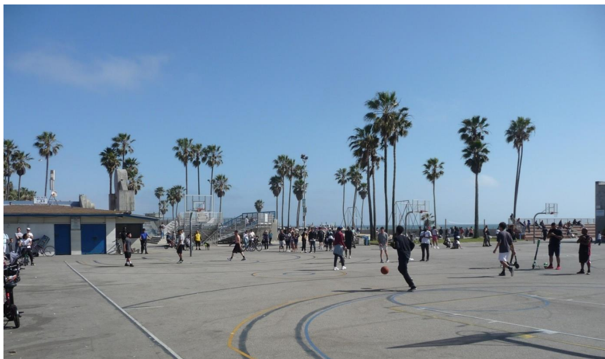
Le voyage s'est terminé par Venice Beach...

[Le groupe des 52 élèves de première et les 4 professeurs accompagnateurs]