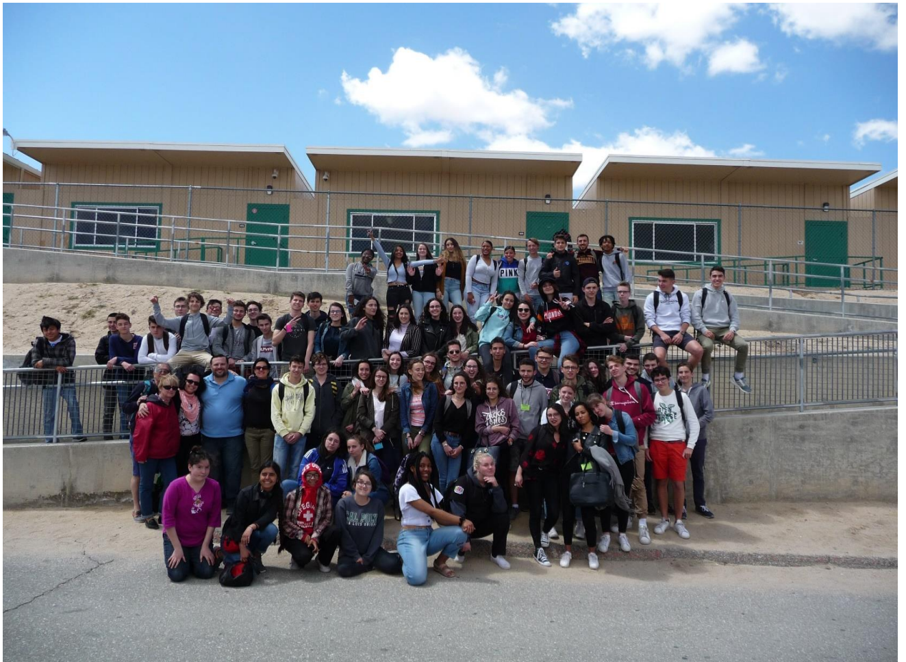
souvenir avec nos amis du Lycée Victor ville High School