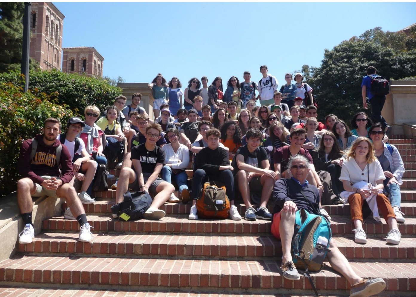
Visite de la très célèbre université UCLA