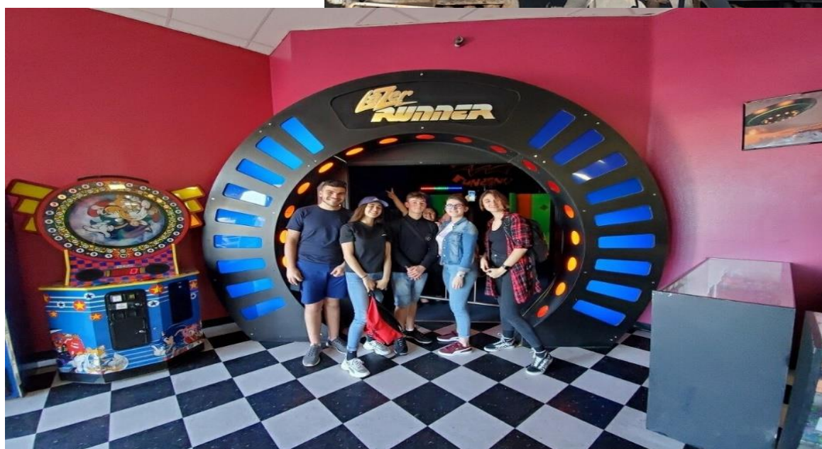
Quelques photos du WE en famille : Certains ont été faire des promenades dans les parcs nationaux. D'autres ont vu la neige ou ont joué au bowling...