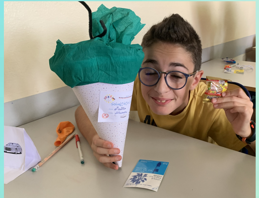
Haribo - Bonbons